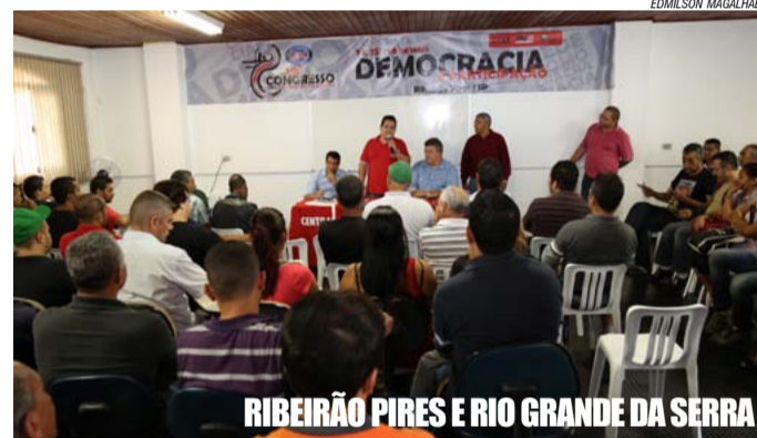
RIBEIRÃO PIRES E RIO GRANDE DA SERRA